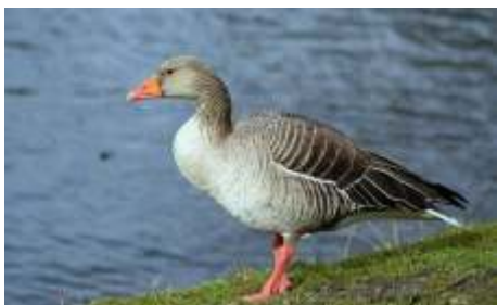
De grauwe gans

In de vijvers zwemmen grauwe ganzen, meerkoeten en wilde eenden. U ziet de gele lis in bosjes in en langs de vijver staan.