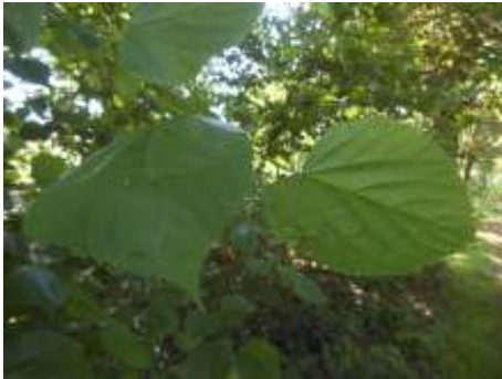
Blad van de linde