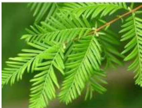
Naalden van de moerascipres