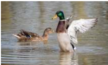
De wilde eend (mannetje en vrouwtje)