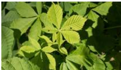
Blad van de paardenkastanjeboom

Op deze plek staat de paardenkastanjeboom met zijn handvormige bladeren. De vruchten van de paardenkastanje zijn niet eetbaar!