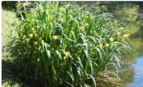
De gele lis

Als u verder gaat komt u bij de tweede vijver en ontdekt u verschillende andere bomen, die nog herinneren aan de naamgeving van de afdelingen in het oude gebouw van Regina Pacis, onder andere de plataan.