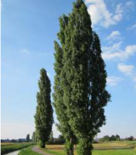
De peppel of populier