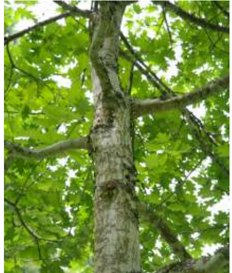
De Amerikaanse eik