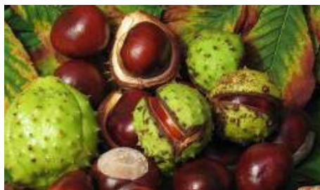
Kastanjes met en zonder bolster