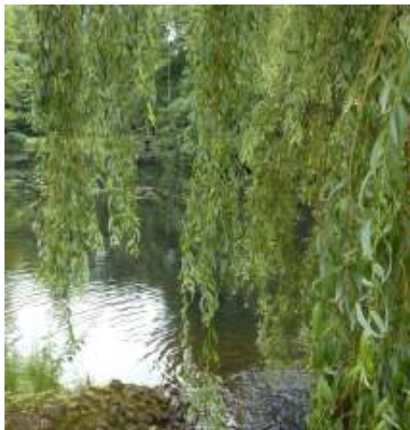
De treurwilg met hangende bladeren