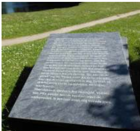
Een granieten tegel met opschrift van Marion Bloem

U ziet in de directe omgeving de steen met Sawah Belanda erop met de bijbehorende kleine rijstvelden. Vanwege ons koude klimaat is het moeilijk om de geplante rijst tot ontkieming te laten komen. Maar als het een warme zomer is kan er in oktober geoogst worden.