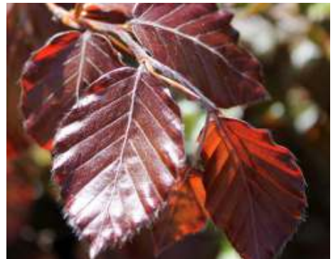
Blad van de rode beuk