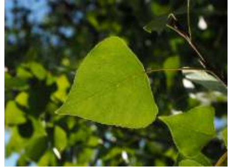
Blad van de peppel of populier