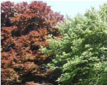
De rode beuk