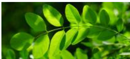
Blad van de acacia

In dit gedeelte van het park staat de acacia. Deze boom heeft een rimpelige stam en het blad bestaat uit vele blaadjes. Het hout van de acacia is duurzaam. Er worden bijvoorbeeld tuinhuisjes van gemaakt.