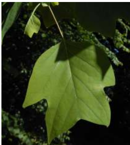
Blad van de tulpenboom