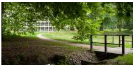
Bruggetje in het park met zicht op Regina Pacis