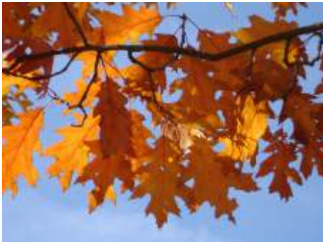
Blad Amerikaanse eik (in de herfst)

Ook ziet u hier de Amerikaanse eik, waarvan het blad in de herfst prachtige kleuren laat zien.