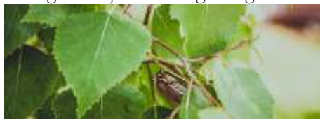
Het blad van de berk

Voordat u bij het wandelpad arriveert komt u de berk al tegen. Kenmerkend voor de berk is de afbladderende bast. De nieuwe bast is vaak wit. Een berkenboom wordt meestal als eerste geplaatst als voorbereider om een nieuw stuk bos of park te creëren. Vroeger werden de berkentakken gebruikt om bezems te maken en werd hiermee menig straatje schoon geveegd.