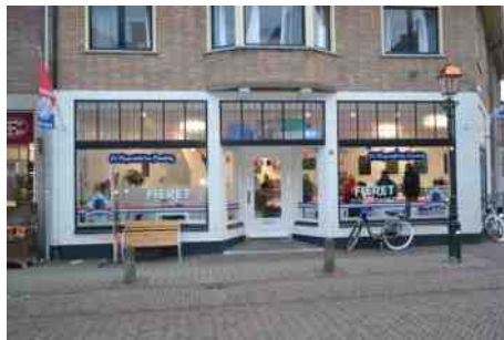
Viswinkel 'Fieret Zeebanket'

In de Meipoortstraat ziet u rechts op de hoek (Meipoortstraat 36/Zandbergstraat) de Viswinkel 'Fieret Zeebanket'. Bij deze viswinkel vindt u een groot assortiment aan verse vis, rechtstreeks van de visafslag dus dagvers. Naast de verse vis hebben zij ook een ruime keuze uit gerookte vissoorten en kant en klaar maaltijden.