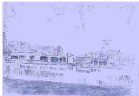
Tekening van woonzorglocatie 'De Hessegracht', getekend door een cliënt.

Attent Zorg en Behandeling Hoofdstraat 8 6994 AE De Steeg