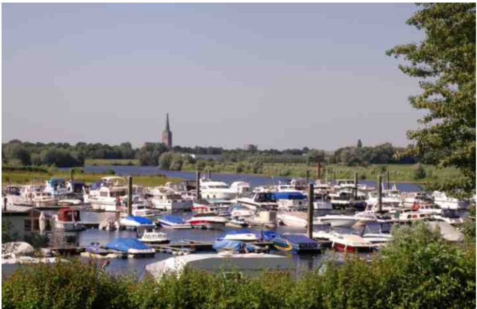
Camping Ijsselstrand met op de achtergrond de kerktoren van Doesburg