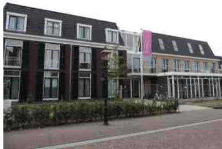
Woonzorglocatie St. Elisabeth

Nu is 'Het Arsenaal' een Grand Café en is er voor iedereen wat te doen: filmavonden, lezingen, gezellig een vorkje meeprikken en wat drinken. Men kan ook terecht bij de wijnhandel en de whisky-winkel.