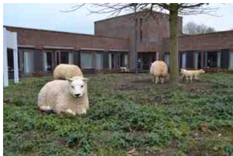
Binnenplein De Hessegracht

Deze route brengt u langs bijzondere plekken van Doesburg. De route is beschreven aan de hand van een aantal oriëntatiepunten.