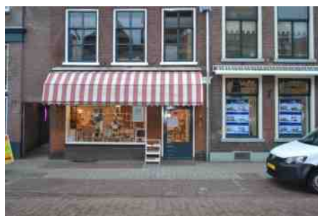
'Stippels en Rozen'

Op de Meipoortstraat 35, aan de linker kant, vindt u de winkel 'Stippels en Rozen'. Dit is een winkel met een uitgebreid assortiment aan sieraden en kralen. Bovendien kunt u er terecht voor een kopje koffie of thee met wat lekkers en/of voor een heerlijke lunch. Dit alles in een gezellige ambiance en in een historische pand in een historische stad.